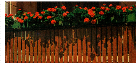
Installation «Urban Geranium»

Seit Ende Mai hat sich der Helvetiaplatz in Bern in einen Ort zum Verweilen, Bestaunen, Begehen, Be«sitzen» verwandelt: Für die Installation «Urban Geranium» stapelt das Alpine Museum klassische Geranienbalkone, die anschliessend von Stadtgrün Bern bepflanzt werden. Es ist durchaus vorgesehen, diese Geranienoase für den Morgencafé oder das sommerliche Mittagsandwich zu nutzen. Ort: Helvetiaplatz 4, Bern www.geraniumcity.ch/installation-urban-geranium-auf-dem-helvetiaplatz/