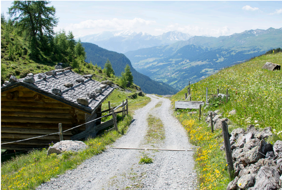
Typischer Weg im naturnahen Zustand im Testgebiet Arosa-Schanfigg

Viele Wanderwege in alpinen Destinationen werden auch für die Land- und Forstwirtschaft genutzt und entsprechend auch ausgebaut. Die Hochschule für Technik und Wirtschaft HTW Chur hat untersucht, inwiefern dieser Ausbau Auswirkungen auf den Tourismus hat. Die Ergebnisse deuten einen jährlichen Verlust an touristischer Wertschöpfung in Millionenhöhe allein im Testgebiet Arosa-Schanfigg an, wenn zu viele naturnahe Wege ausgebaut werden.