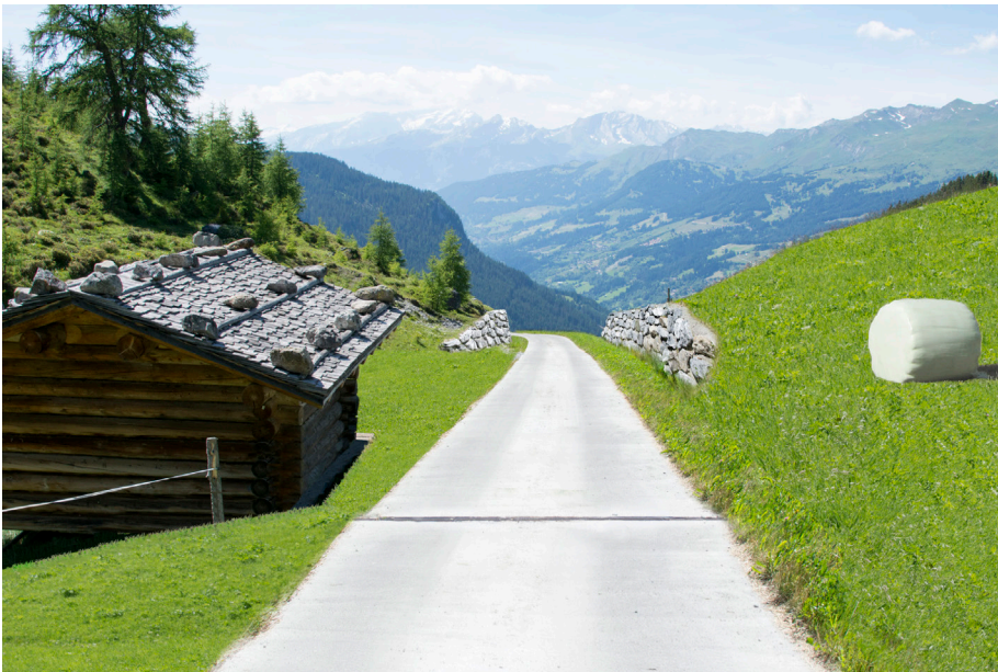
Bearbeitetes Bild der gleichen Situation im Testgebiet Arosa-Schanfigg, mit Ausbaumaßnahmen inkl. vollständiger Asphaltierung.

mehr als 92% der Gäste bewerten den Idealtyp eines naturnahen Weges deutlich positiv. Die Fotomontage eines ausgebauten Weges mit Betonspuren und Grünstreifen, sowie den einhergehenden Veränderungen im Landschaftsbild (z.B. Schnittwiesen, Stützmauern etc.) werden eher negativ bis sehr negativ bewertet. Die Befragten bevorzugen Landschaftsbilder mit naturnahen Wegen, Kleinstrukturen und abwechslungsreicher Natur. Sie gaben an, bei zu hohem Ausbaugrad die Wanderregion nicht mehr zu besuchen.