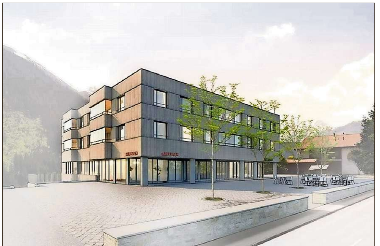
■ Visualisaziun dalla residenza da seniors preveda a Sedrun.

Medemamein ha la radunonza da vischnaunca concedu in credit da 2,13 milliuns francs per la construcziun dalla garascha, dil plaz avon la residenza e dils parcadis dalla vart dil vest dil baghetg dalla Residenza Dulezi.