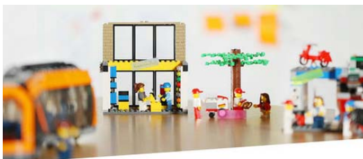
Service Innovation Lab